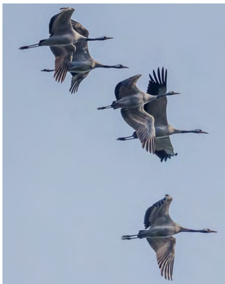
Kraanvogels boven de Grootte Peel op weg naar Lac dur Der

Een foto-impressie van deze excursie is te zien op: https://www.flickr.com/photos/jeroengosse/sets/in de map 'Kranen boven de Peelvenen' . Op de facebookpagina van de VWGA staat een link naar de foto's.