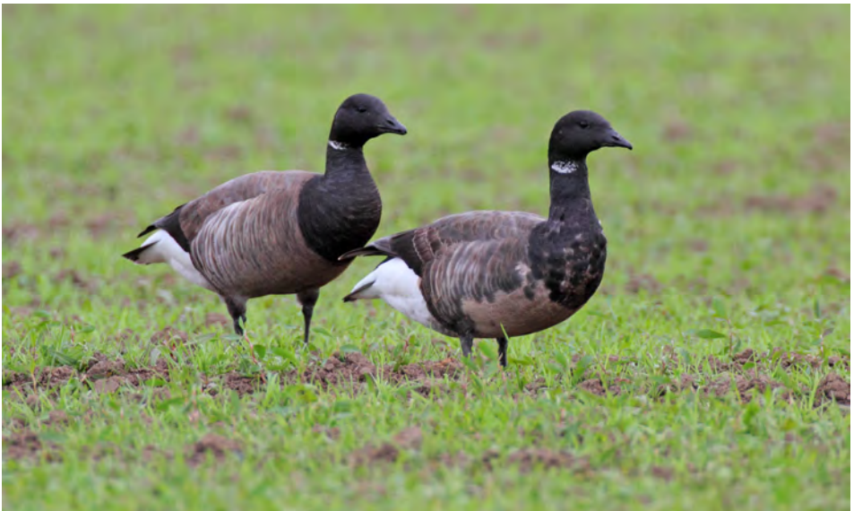
Rotganzen, inlagen Scherpenisse, 25 mei 2014