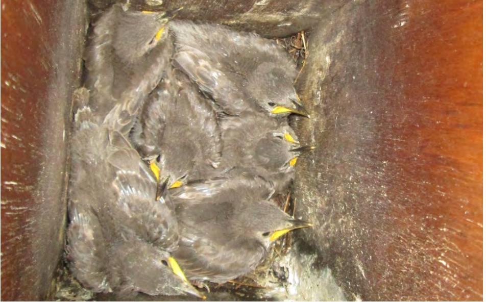
Jonge Spreeuwen in nestkast in Papendal, 25 april 2014

duizenden op een zonnige dag eind juni uit ons grasveld opvlogen. De Spreeuwen foerageerden daarop. Deze rood-met-groene kevertjes behoren tot de meikeverachtigen (Scarabaeidae) en hun larven knabbelen net zo hard aan de graswortels als de engerlingen, maar zijn alleen een maatje kleiner. Misschien moeten wij toch denken aan de twee extreme voorgaande winters: 2013 streng en lang, waardoor het voortplantingseizoen te laat begon en 2014 warm en vochtig, waardoor veel insecten schimmelinfecties en andere gevaren liepen ... Alles was een beetje verstoord. Meestal kan de natuur zo'n dipje wel weer herstellen.