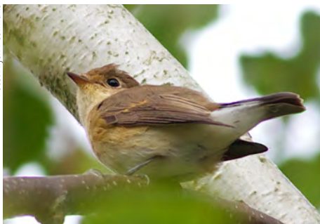
Kleine Vliegenvanger, eerstejaars, Falsterbo, 28 september 2014

met lage duintjes en struiken omzoomde Flommen's Golf Club. Van daaruit kijk je uit op duinmeertjes en muien met watervogels en steltlopers met daarachter de zee. Een matige zuidwestenwind, dus wat tegenwind, biedt de beste kansen om veel vogels van dichtbij te zien. Anders dan bij zuidwesterstorm wagen ze dan, laag en dicht op elkaar vliegend, meestal wel de oversteek. Per soort kunnen de dagaantallen sterk variëren. Je kunt dit van dag tot dag nagaan op www.falsterbofagelstation.se , Engelse versie, Migration counts. Zo piekten op 23 sept bij voorbeeld Kraanvogels (1.910 exemplaren) en Rode Wouwen (714), op 28 sept Kneutjes (23.250) en Vinken/Kepen (188.900) en op 29 sept Sperwers (668), Boerenzwaluwen (1.220) en Pimpelmezen (3.530). Bij zonnig weer gaan veel vogelaars later op de dag naar de heide ten oosten van Falsterbo. Daar thermieken graag roofvogels tot grote hoogte om zich daarna energiezuinig zuidwestwaarts te laten glijden. De groep van Arjen spotte hier de eerste middag een adulte Zeearend en een Roodkeelpieper, de volgende dagen op de punt veel Vinken, dertig Grote Gele Kwikstaarten, een Klapekster, over zee Middelste Zaagbekken, Zwarte en Grote Zee-eenden, Zilverplevieren en Rosse Grutto's en in het dorpsgroen een Kleine Vliegenvanger en een Taigaboomkruiper. De groep van Koos zag onder meer een Schreeuwarend, Strandplevier, Sneeuwgorst en IJsgorst.