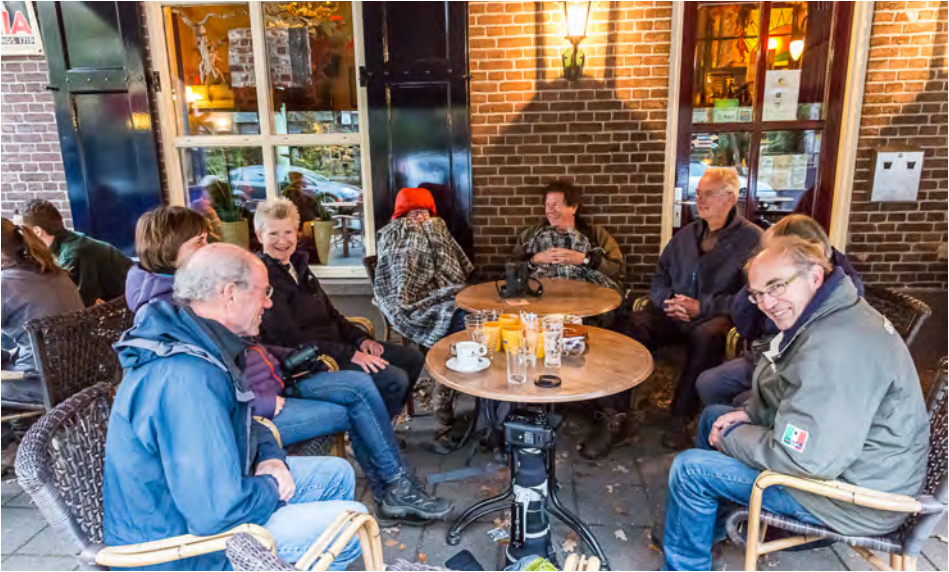
Excursiedeelnemers op het terras (9 november!)

onthoud ik zo spontaan de latijnse naam: Grus grus.