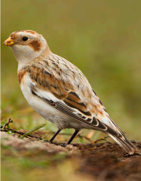
Sneeuwgors, Renkum, 17 november 13

de bomen kan ik slechts een klein aantal ganzen checken. De visser draait al het pad naar de plas op. Gelukkig vliegen er slechts een paar honderd ganzen op van de plas die alle dicht langs me heen komen en zich goed laten bekijken. Geen Rotgans ertussen. Snel loop ik naar de plas waar inderdaad nog vele honderden ganzen rondzwemmen. Een snelle scan met de verrekijker levert in eerste instantie geen resultaat op. Dan komt er vanuit een inham een groepje kollen mooi dichtbij aanzwemmen en warempel 12x is scheepsrecht! De Rotgans zwemt ertussen en is eindelijk binnen (#246). Ik kan nog een bewijsfilmpje maken en dan vliegen alle ganzen op om te gaan foerageren op de weilanden elders.