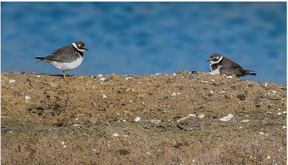
Bontbekplevieren, Azewijnsche Broek, 12 oktober 2014