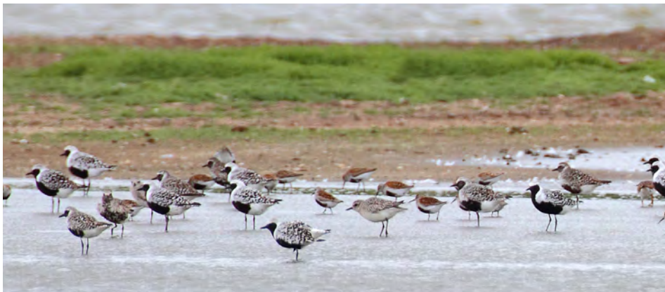
Zilverplevieren en Bonte Strandlopers, Tiengemeten, inlaag Scherpenissepolder, 25 mei 2014

een 3 km lange plas in het gebied “Weelde”. De Camping is goed beschut tegen wind en zon, in een pruimenboomgaard en de Herberg ( met 6 tweepersoonskamers) liggen op de oostpunt van het eiland, 3,5 km van de haven. Het landschap bestaat vooral uit polder en dijk met sloten, drie forse ondiepe plassen, slielveldjes, rietkragen en rietland. Vooral vanaf de graspaden is het te voet leuk vogelen en we moeten opletten niet de tientallen 6 cm lange, harige rupsen (donker met oranje bies) mogelijk van beervlinders, te vertrappen. Een erg mooie binnenkomer is een groep van ca. 15 Zilverplevieren, deels in prachtkleed, en zomerse Bonte Strandlopers ervóór. Vanaf de Vliedberg een mooi overzicht met Grauwe en Brandganzen en Bergeenden, alle met veel jongen. Ook zien we Rotganzen, Knobbelzwanen, Lepelaars, Grote Zilverreiger, Zomer- en Wintertaling, Scholeksters, Kieviten, en Kluten. Heel verrassend is de Steltkluut, die er op zondag een maatje bij krijgt. De hoempende Roerdomp vliegt stilletjes in het mooie namiddaglicht op maar slechts enkelen zien hem. Ook Blauwe en Bruine Kiekendief passeren. Op de avondwandeling naar de vogelkijkhut: