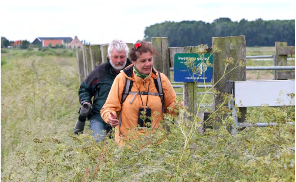
Excursiedeelnemers, Scherpenissepolder, 25 mei 2014