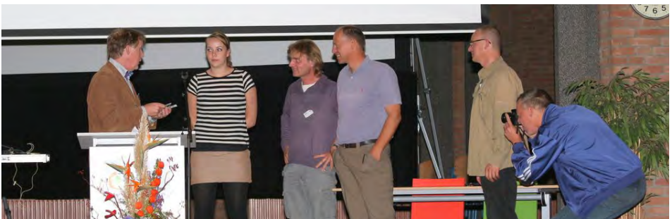
Voorzitter VWG overhandigt een presentje aan een aantal sprekers