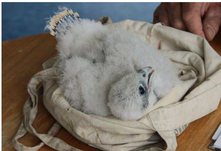
Ringen van de jonge Slechtvalk op de toren van Presikhaaf, 23 mei 2014