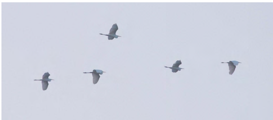
Grote Zilverreigers, telpost Zeegbos