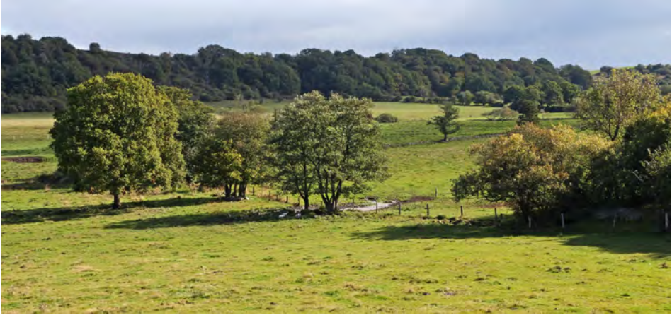
Fyledalen Skane, 25 september 2014

Een uitnodigend overzicht met kaartjes vinden wij in 'A Guide to Birdwatching in Skåne', een uitgave van de Skånes Ornitologiska Förening ( www.skof.se ). Beide groepen bezochten het gebied bij Börringesjön en Havgårdssjön waar we vijf Zeearenden tegelijk zagen ronddraaien en twee dagen later bij elkaar een Steenarend, twee Raven en acht Rode Wouwen. Richting Anderslöv ontdekten wij een nieuw ven met veel Dodaarzen en een complete familie Roodhalsfuten. De groep van Koos bezocht nog het Dalby Söderskog, een eeuwenoud loofbos met drie soorten spechten, Appelvinken en in aangrenzend natuurgrasland distelzaden etende Geelgorzen en Matkoppen. Wat oostelijker genoten we bij Krankesjön en Vombsjön van vissende Zee- en Visarenden, twee IJsvogels en overtrekkende groepen Kraanvogels. Prachtig vonden we ten slotte Fyledalen, zo'n 70 km ten oostnoordoosten van Falsterbo, een oud landgoed waar vanuit de bosrand de Groene en Zwarte Specht riepen en opnieuw Rode Wouwen en een Steenarend rondcirkelden en groepen Kraanvogels