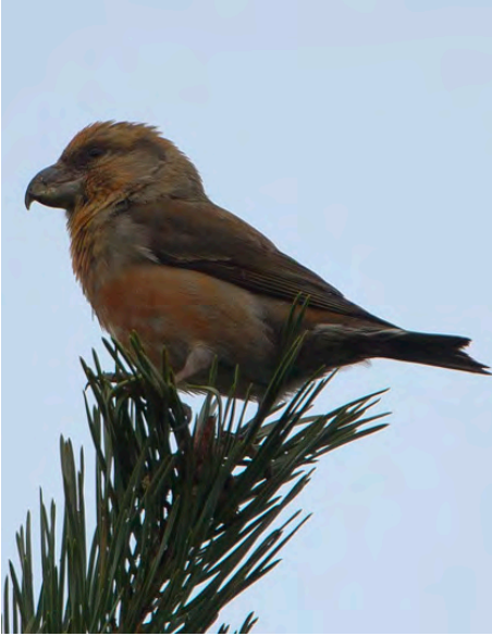
Grote Kruisbek, man, Hoge Veluwe