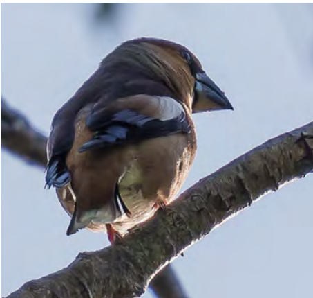
Appelvink, Beekhuizen, maart 2014