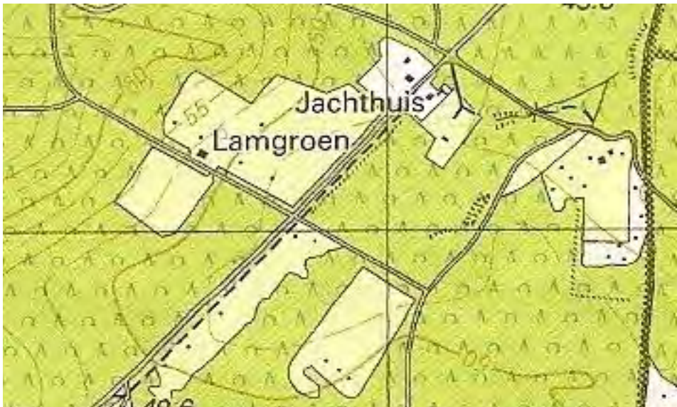
Topografisch kaartje van de Buurtschap Imbosch. De weides zijn lichtgeel. De Eerbeekse weg loopt van linksonder naar rechtsboven. De beukenlanen vormen het assenkruis van de wegen midden op het kaartje. De donkere lijn rechts is de Ringallee.

Op 21 januari 2014 zingt de eerst aangekomen Spreeuw in de beukenlaan (Eerbeekse weg). De mannetjes zijn lang alleen, maar in maart zijn er tien vogels aanwezig. Mannen en vrouwen zoeken voedsel op de wei achter het Jachthuis en er klinkt nog steeds zang in de bomen op de wildwallen en in de beukenlanen. Eind maart schreef ik in mijn vogeldagboek: "een paar heeft de spechtenkast geclaimd, maar daar zitten al