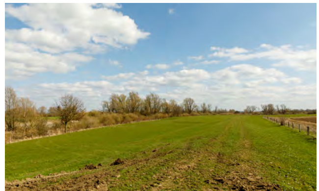
Grasland Gelderse Waard