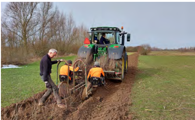
Werkzaamheden Rosandse Polder

Er zijn vijftien Natura 2000-gebieden in Gelderland, waarvan Rijnstrangen er één is. De provincie werkt in deze gebieden aan het beschermen, herstellen en versterken van de natuur. In de Rosandse Polder betaalt de provincie het merendeel van de kosten van de beplanting en de aanleg van landschapselementen. Ook compenseert de provincie de waardedaling voor omvorming van agrarische grond naar natuurgrond. Stichting Twickel beheert straks de gronden en maakt daarvoor gebruik van de provinciale subsidieregeling voor Agrarisch Natuur- en Landschapsbeheer (ANLb).