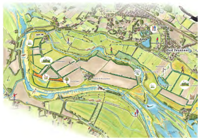
Tekening vogelvlucht Rijnstrangen

natuurontwikkeling, landbouwstructuurverbetering, natuurinclusiviteit, landschapsherstel en recreatie. Aan de hand van een vogelvluchttekening zien passanten het eindbeeld. Deze tekening is van Dirk Oomen van Ontwerpbureau Oomen.