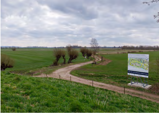
Informatiebord over werkzaamheden

Om de bezoekers te laten weten dat er in het gebied gewerkt wordt aan natuurinclusieve landbouw, landschapselementen en wandelpaden, liet Provincie Gelderland een informatiebord plaatsen. Ook valt te lezen welke partijen via kavelruil samen werken aan