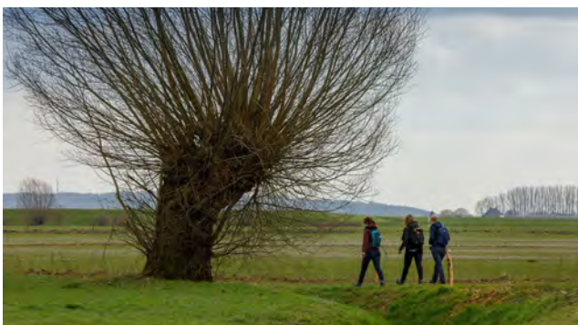
Wandelaars in de Rosandse Polder