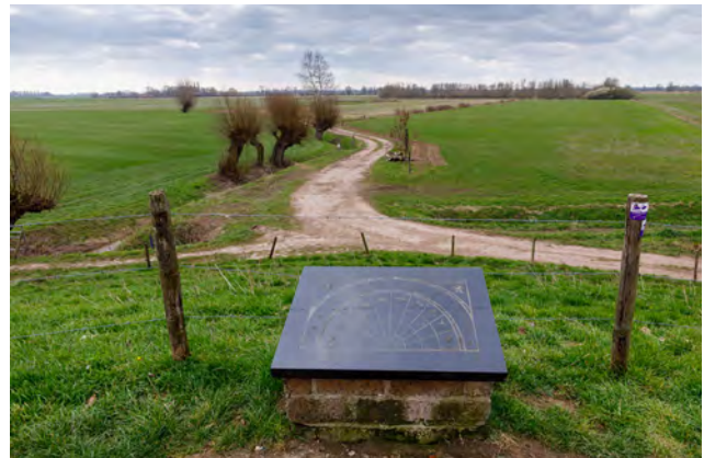
Observatiepunt Rosandse Polder