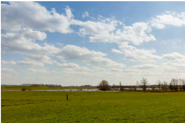
Oud Zevenaarsedijk Oude Rijnstrang

Ongeveer 55 eigenaren hebben in totaal 267 hectare grond geruild. Zo'n 134 hectare is beschikbaar voor natuurontwikkeling, waarvan 30 km bestaat uit hagen. Voor 22 bedrijven is de landbouwstructuur verbeterd, waarvoor 53 hectare is geruild. Bij vijf partijen is de ligging van 130 hectare verbeterd. Voor natuurinclusief boeren is 42 hectare beschikbaar. Gemeente Zevenaar en andere partijen realiseren ruim twaalf kilometer recreatieve paden en voor tien particulieren is de vorm van hun kavel en erf verbeterd. Deze resultaten van de kavelruil dragen bij aan extra ruimte voor een duurzaam rietmoeras en de daarbij horende moerasvogels. En daarmee aan de doelen van Provincie Gelderland.